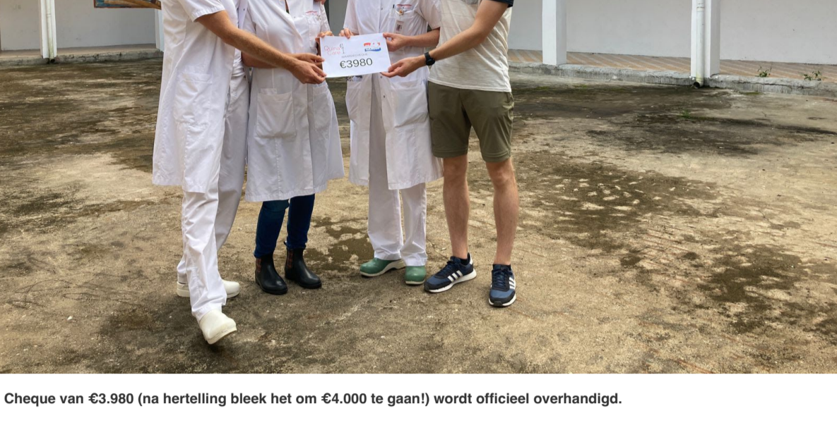
Cheque van €3.980 (na hertelling bleek het om €4.000 te gaan!) wordt officieel overhandigd.