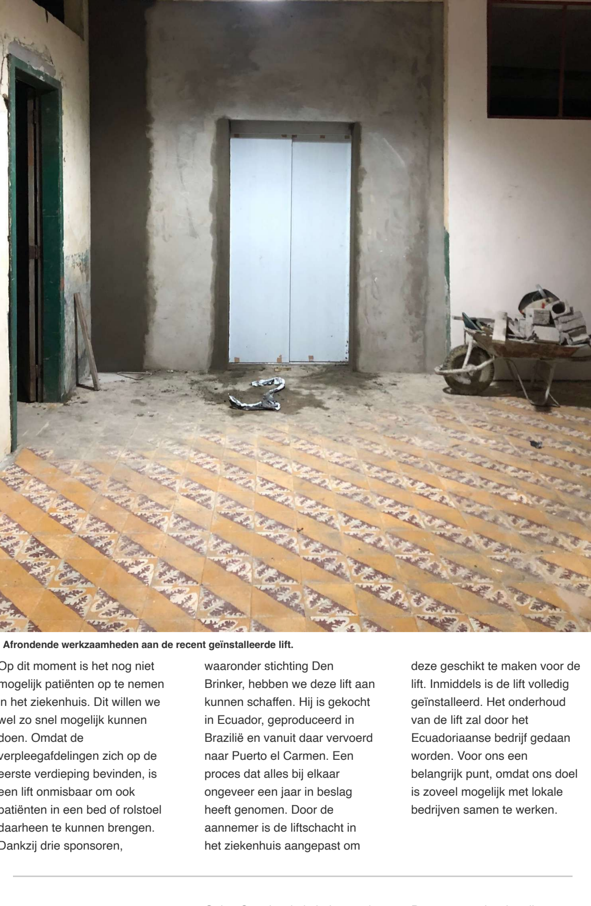
Afrondende werkzaamheden aan de recent geïnstalleerde lift.

Op dit moment is het nog niet mogelijk patiënten op te nemen in het ziekenhuis. Dit willen we wel zo snel mogelijk kunnen doen. Omdat de verpleegafdelingen zich op de eerste verdieping bevinden, is een lift onmisbaar om ook patiënten in een bed of rolstoel daarheen te kunnen brengen. Dankzij drie sponsors,